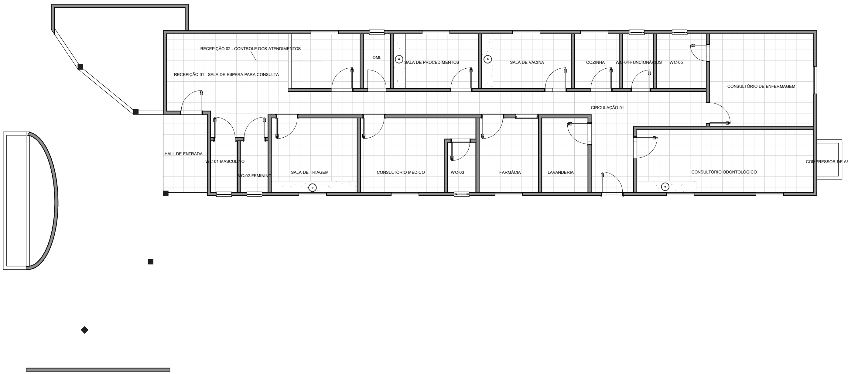
2 DT PLANTA TÉRREO LAYOUT-REFORMA 1 : 100